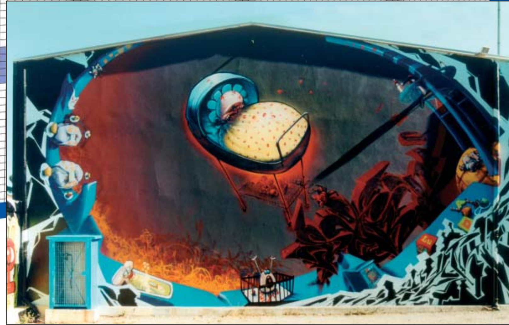
one toast, some friends and lots of letters [france]