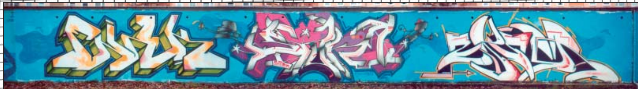
fnack - stuka - zaser [braunschweig]