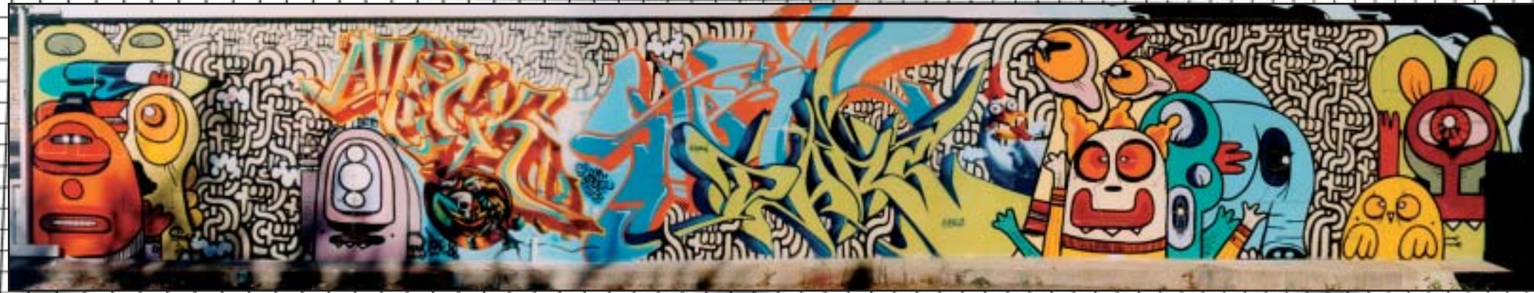
one dare, some friends, a few characters and a bunch of hands [france]