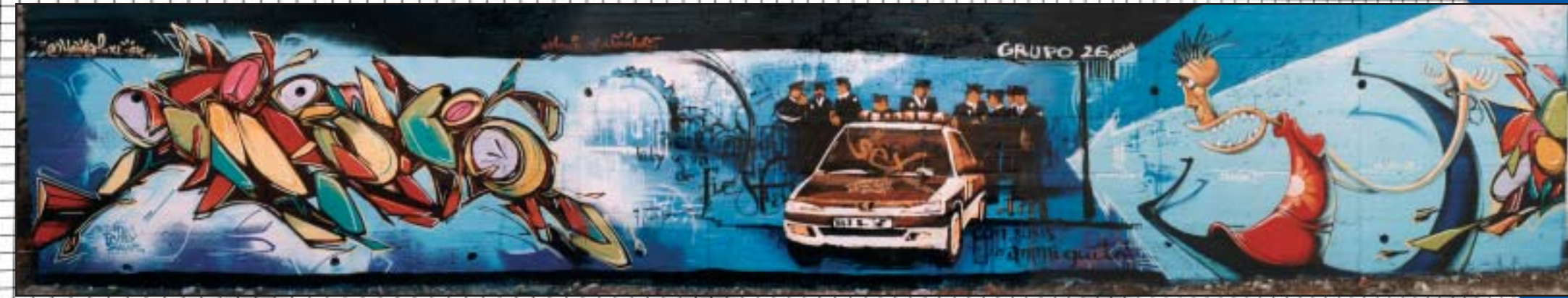
hanem - sex - dico [france]