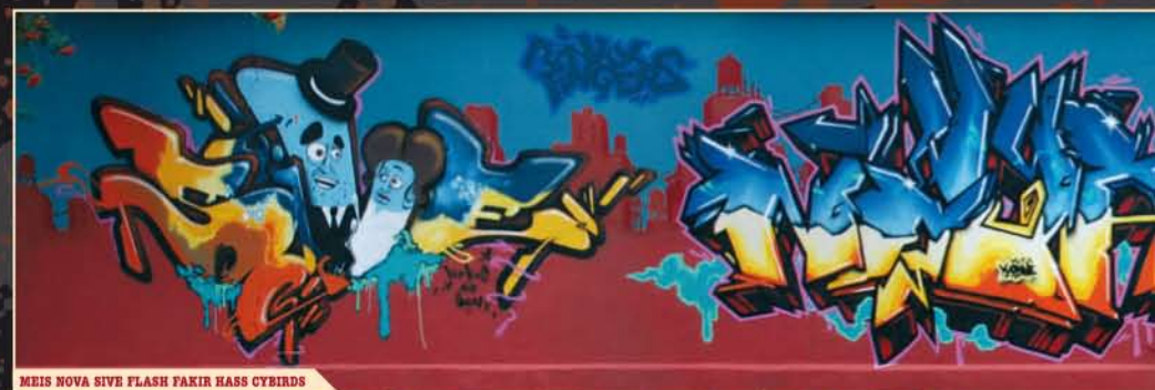
MEIS NOVA SIVE FLASH FAKIR HASS CYBIRDS