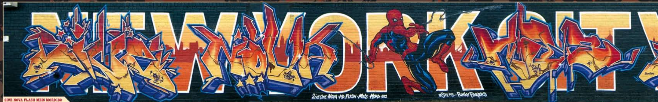
SIVE NOVA FLASH MEIS MORD182