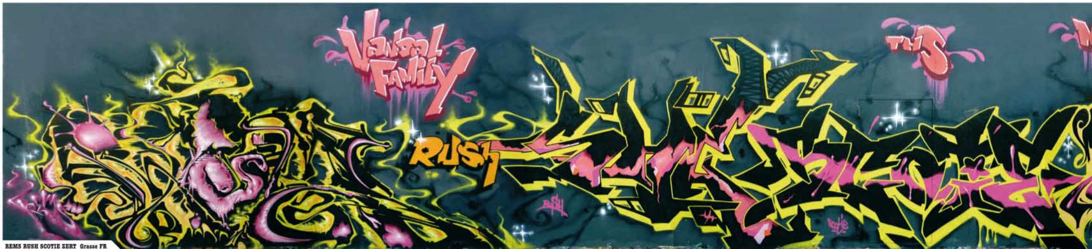
REIMS RUSH SCOTIE ZERT Grasse FR