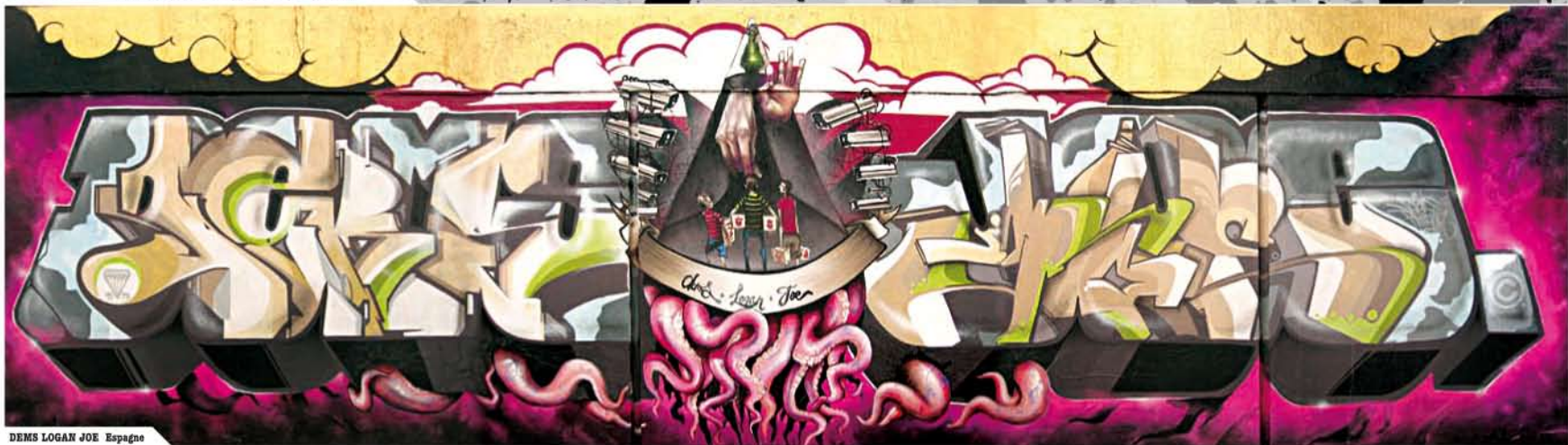
DEMS LOGAN JOE Espagne