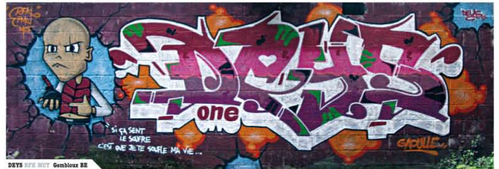
DEYS RFX MCT Gembloux BE