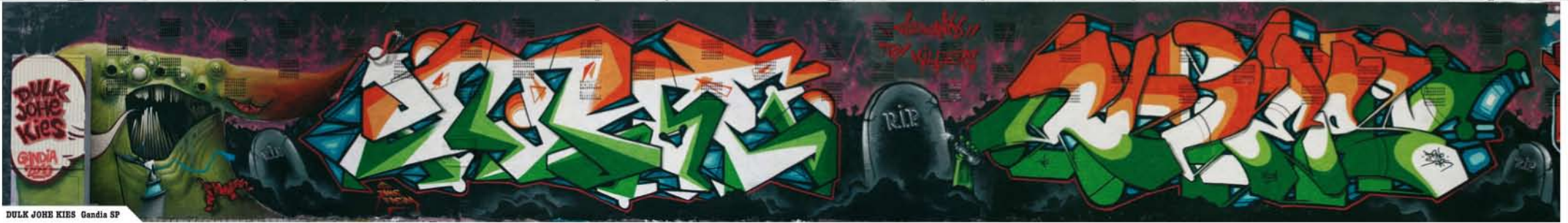
DULK JOHE KIES Gandia SP