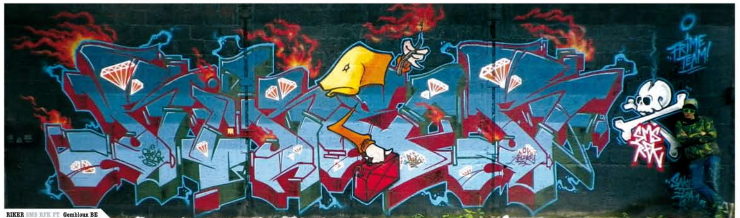
RIKER DMS RFX FT Gembloux BE