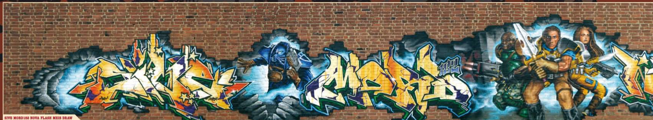
SIVE MORD182 NOVA FLASH MEIS DRAW