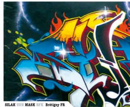
SILAK UDN MASK NFN Brétigny FR