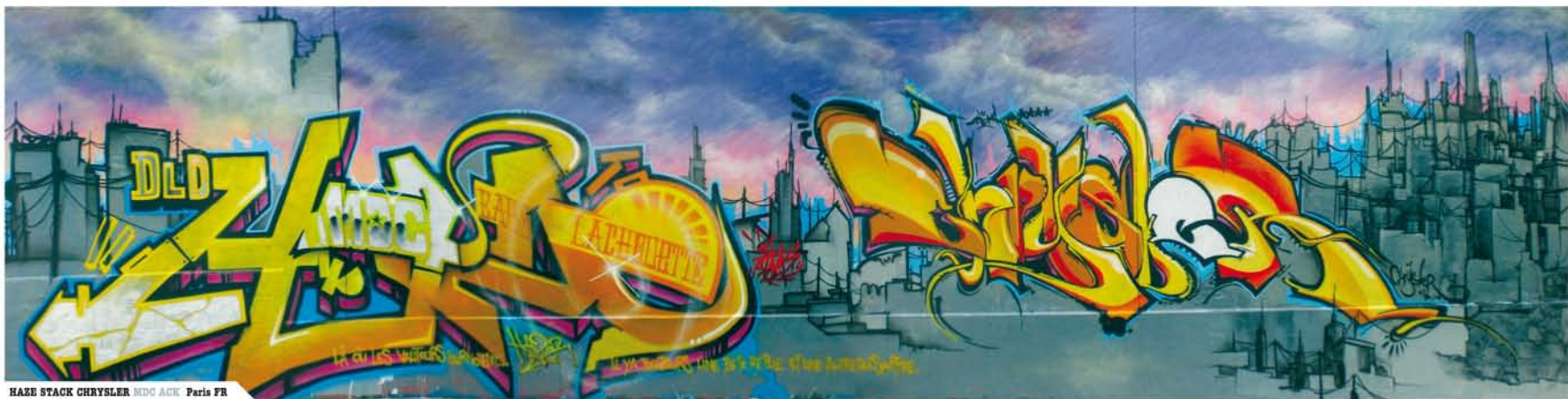
HAZE STACK CHRYSLER MIDG ACK Paris FR