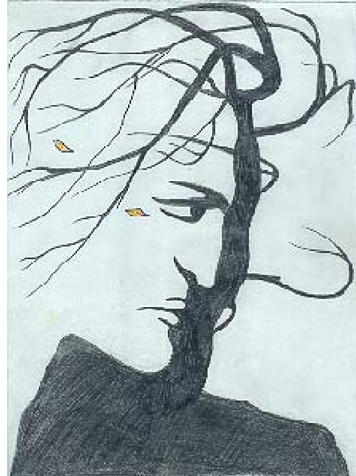
Смешение: порядок и хаос (жизнь и умирание)