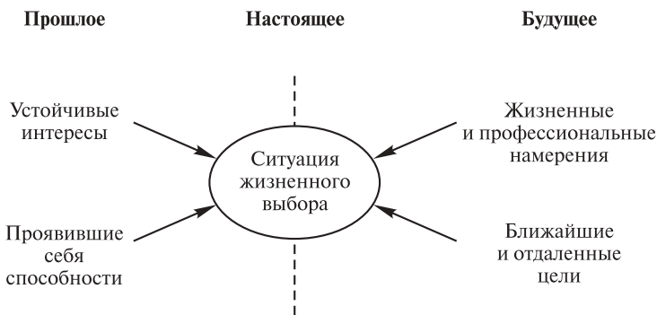
Рис. 1. Схема ситуации жизненного выбора

жекты рассыпаются как карточные домики 1 . Во избежание подобного нужно, чтобы между событиями прошлого и намечаемого будущего были мысленно установлены и обдуманы причинно-целевые связи и чтобы они «завязались узлом» на настоящем. Формула таких отношений — прошлое влияет на настоящее через мыслимое будущее . Прошлым обусловлены уже развитые способности и сложившиеся устойчивые интересы, из воображаемого будущего на нас оказывают влияние цели и соответствующие им намерения. Исходя из множества таких влияний, человек должен сделать свой собственный выбор в настоящем. Итак, ситуацию жизненного и профессионального выбора можно представить схематически следующим образом (рис. 1):