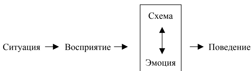
Схема 1. Процесс переработки социальной информации

Поскольку на каждом этапе переработки социальной информации оказываются задействованными различные психические процессы, то и протекание защитных механизмов на каждом из них будет принципиально различным. Мы предлагаем следующее соотнесение различных видов защитных механизмов с этапами переработки социальной информации: